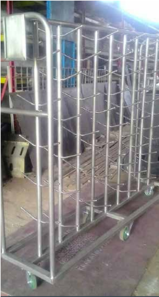
TROLLEY BENANG PT SRITEX