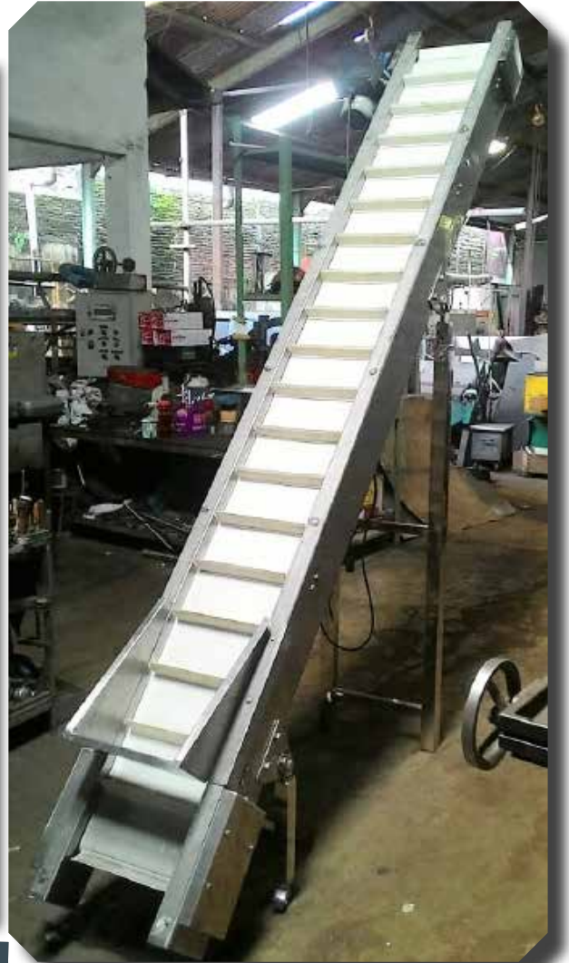
CONVEYOR ICLAN CU DIAN SEHATI