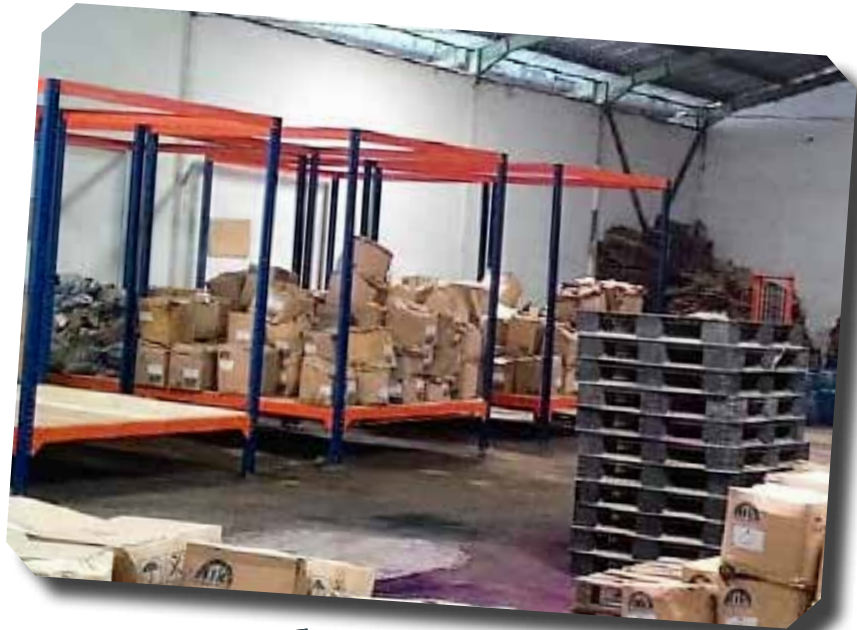
RAK OBAT KIMIA PT MULTIKIMIA INDAH