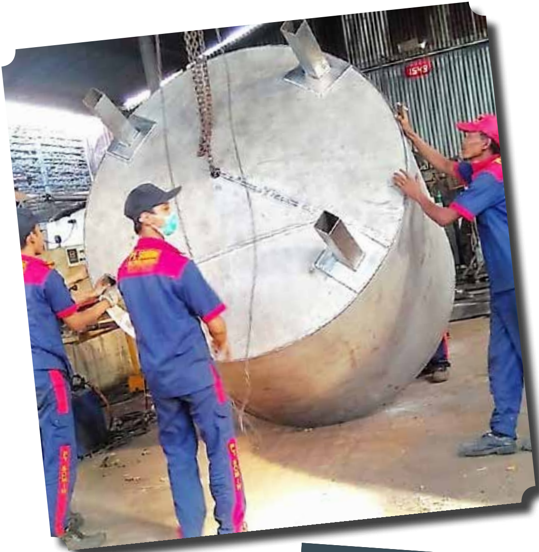
TANGKI CAUSTIC PT SRITEX