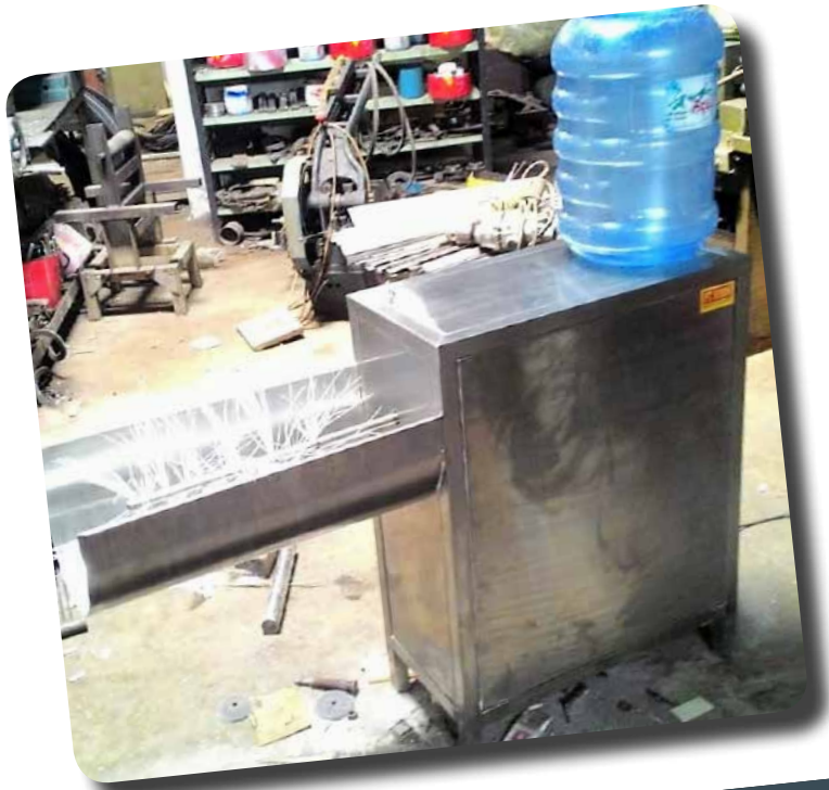
GALON CLEANER PEMBERSIH GALON