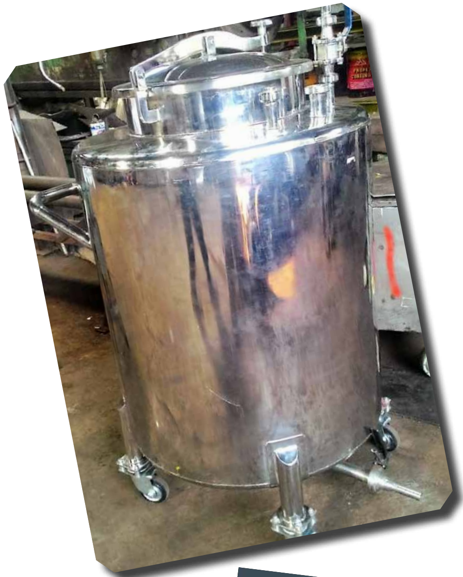
TANGKI PENAMPUNG OBAT PT DELTOMED