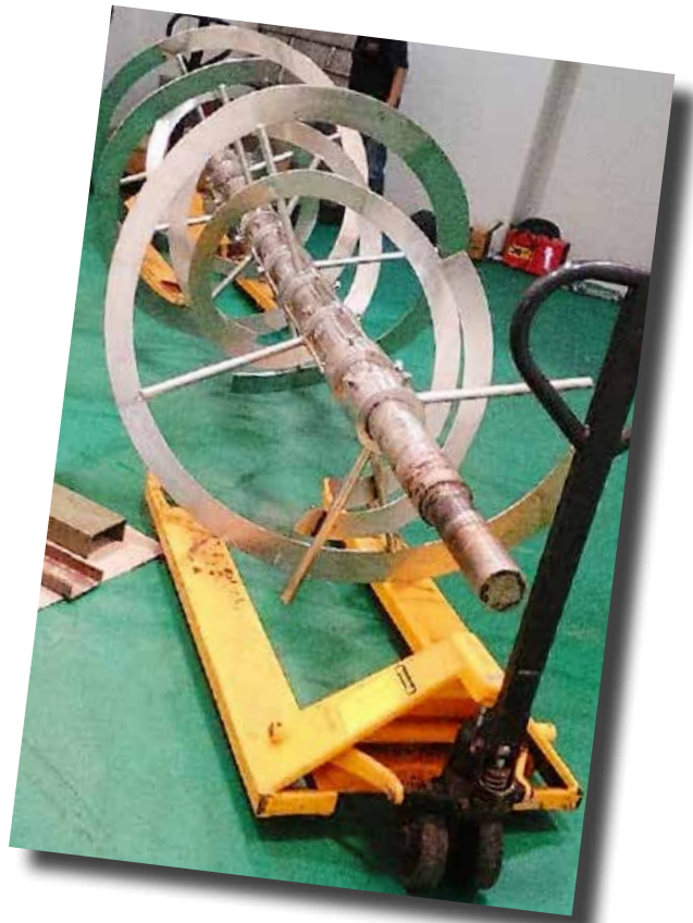
MIXER TEPUNG 2,5 TON PT GARUDAFOOD