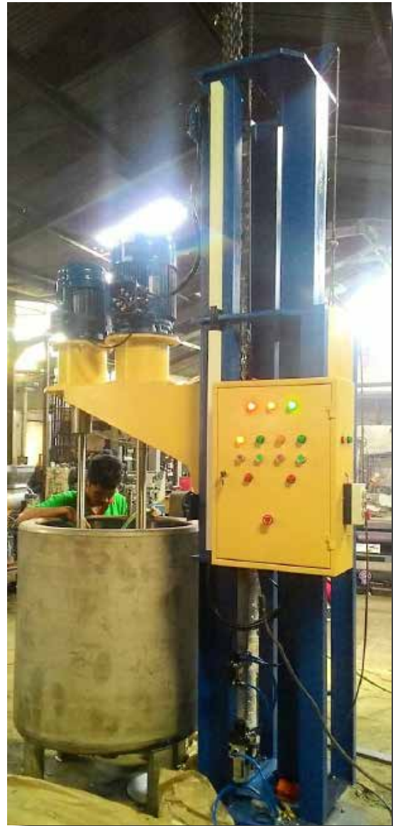
MIXER KANJI PT SRITEX