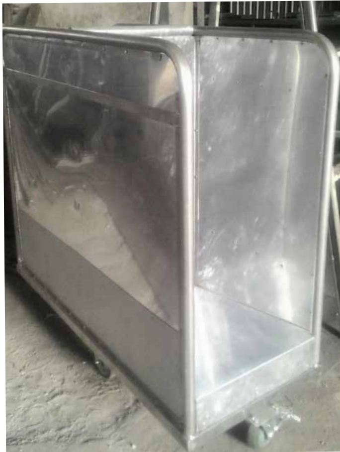
TROLLEY ROFING PT SRITEX