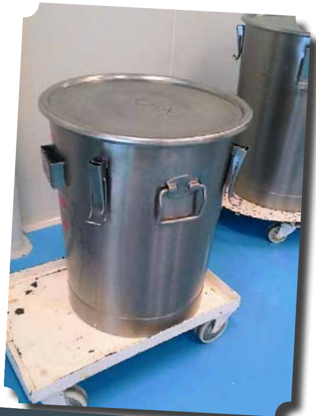
EMBER PENAMPUNG PT KONIMEX