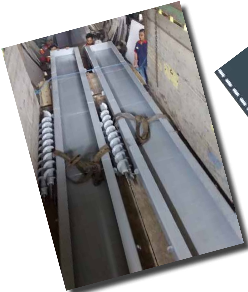
FRAME CYLINDER DRYER P SRITEX