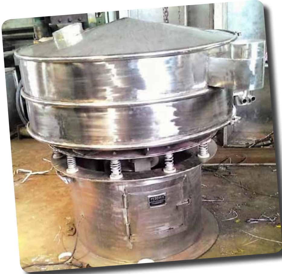
AYAK FIBRO PT GARUDAFOOD