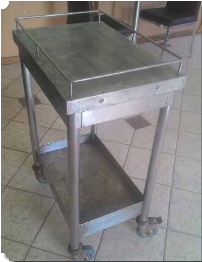
MEJA LAB PT GRAHA FARMA