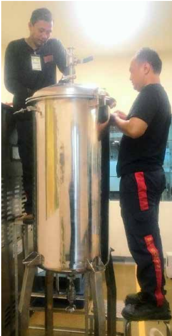
TANGKI MULTION PT JAVAPLANT