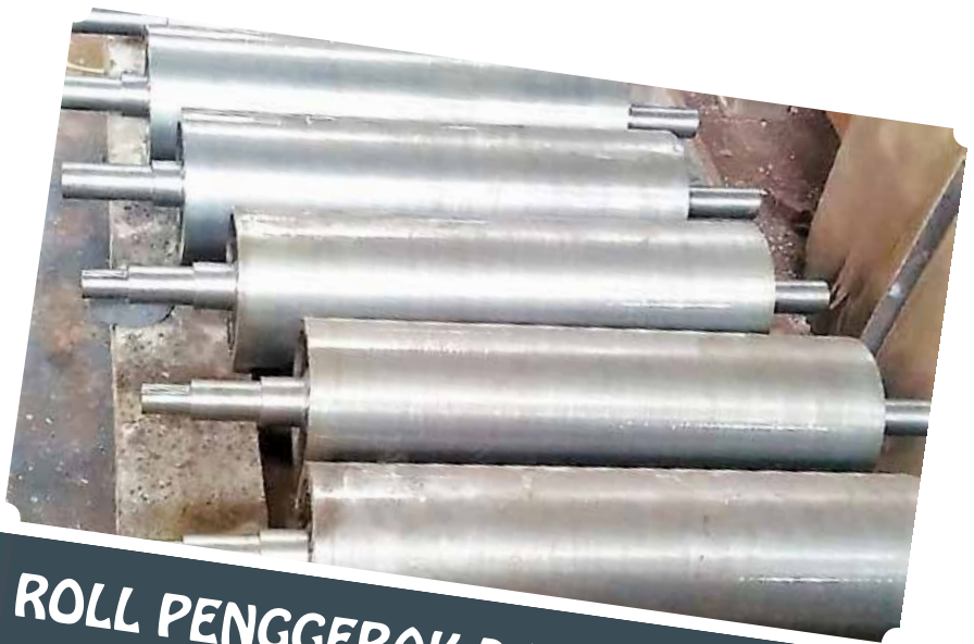
ROLL PENGGERAK DAN PENGIKUT PABRIK PUPUK