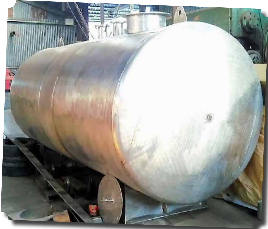
TANGKI AIR PT SARIWARNA