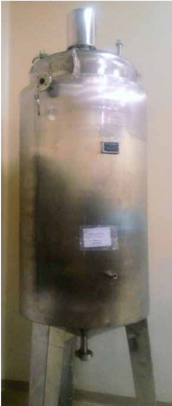
MIXER TANK PT DELTOMED