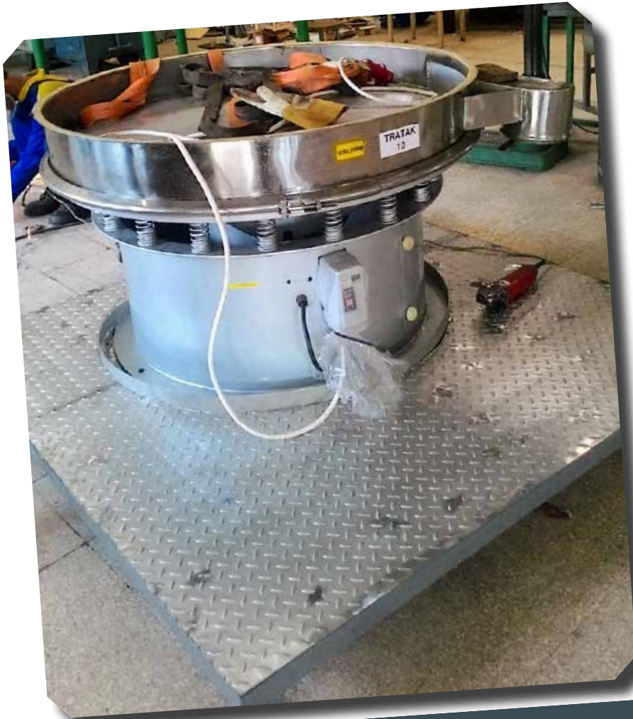
AYAKAN VIBRO PT KONIMEX