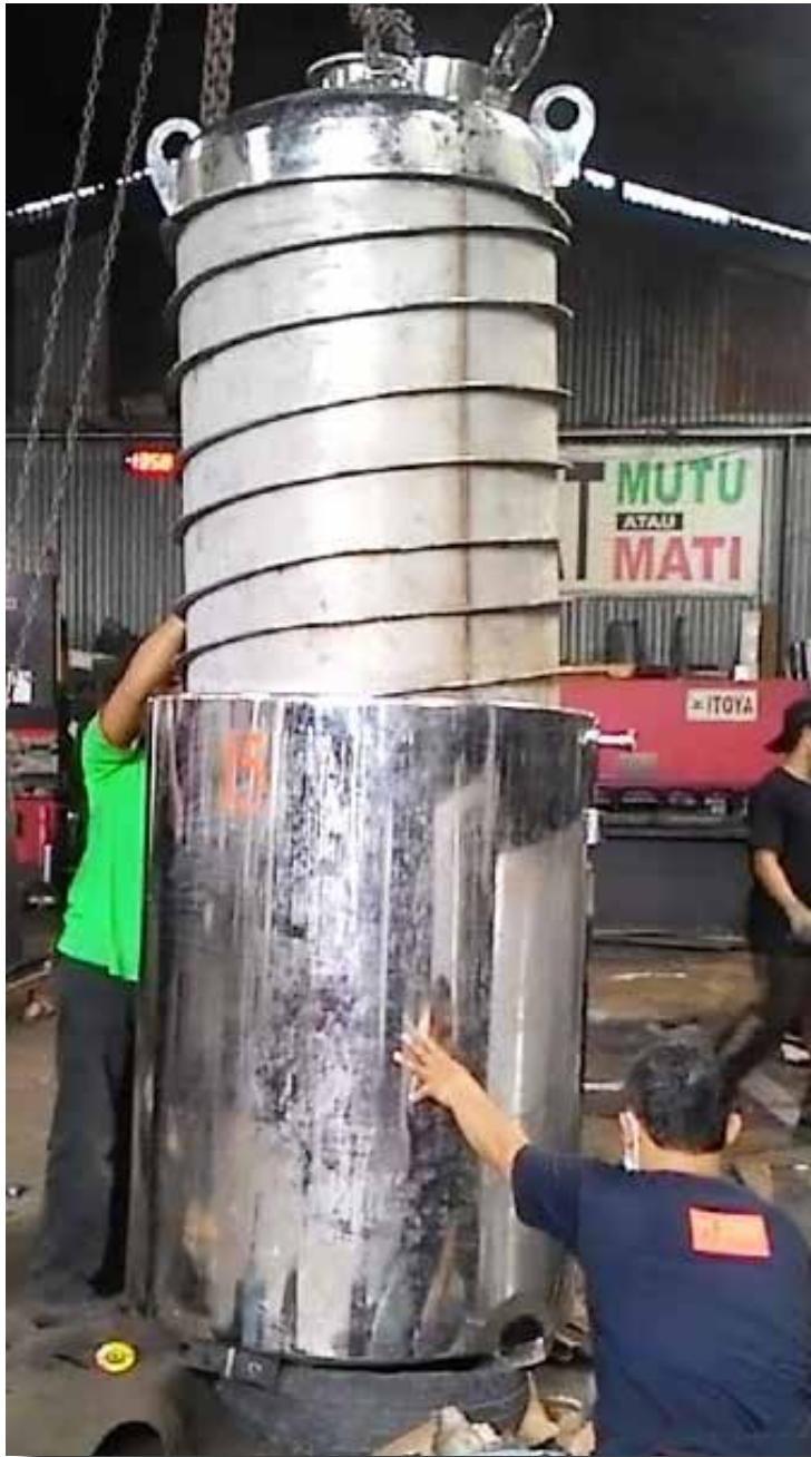
TANGKI MIXER TRIPEL JAKET PT DELTOMED