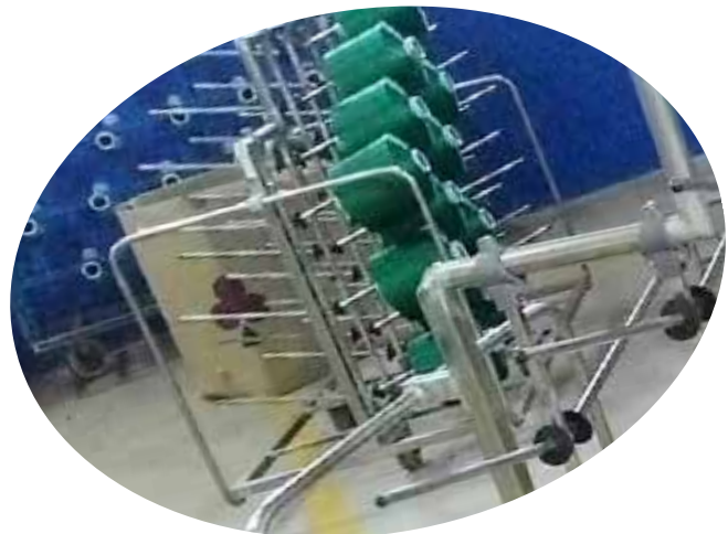
TROLLEY BENANG MUTU GADING