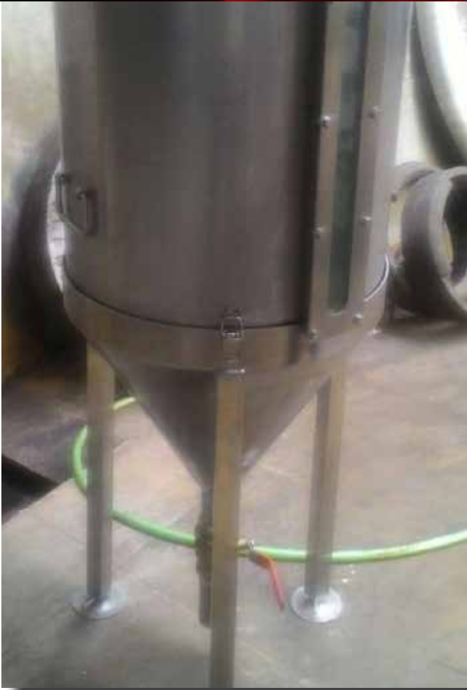
BEJANA UKUR BMKG